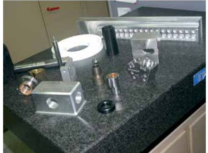
6 Das Produktspektrum von MBS ist breit gefächert. Ob groß oder klein, in Edelstahl, Alu oder Kunststoff, als Einzelteil oder in größeren Stückzahlen – der Lohnfertiger sorgt dafür, dass seine Kunden stets in hoher Qualität und termintreu beliefert werden

nung von Siemens bei: Die Sinumerik 828D bietet beispielsweise mit der sogenannten 80-Bit-Nano-Genauigkeit äußerst hohe Präzision, die gleichermaßen in der CNC und in den verwendeten Sinamics-Antrieben erreicht wird. Moderne Prozessortechnik und Softwarearchitektur macht dies möglich. Auf diese Weise schließt Siemens Rundungsfehler in der Software aus und gewährleistet eine exakte Bahnführung, was sich in bestmöglicher Genauigkeit am Werkstück widerspiegelt.