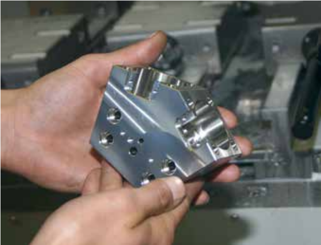
5 Komplexe kleine Werkstücke – für den Lohnfertiger MBS kein Problem. Damit sich alle Kundenwünsche verwirklichen lassen, stehen den in allen Bearbeitungsverfahren flexibel einsetzbaren Facharbeitern des Unternehmens unter anderem mit vier MTCut V110 hochmoderne Bearbeitungszentren zur Verfügung